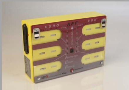
EUROBOX Berlin (30019)