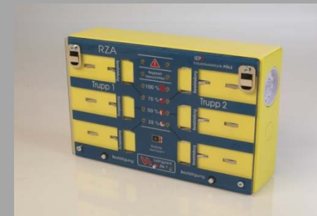
EUROBOX Mannheim (30046)